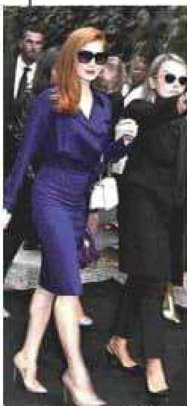
18 SETTEMBRE ORE 15.5