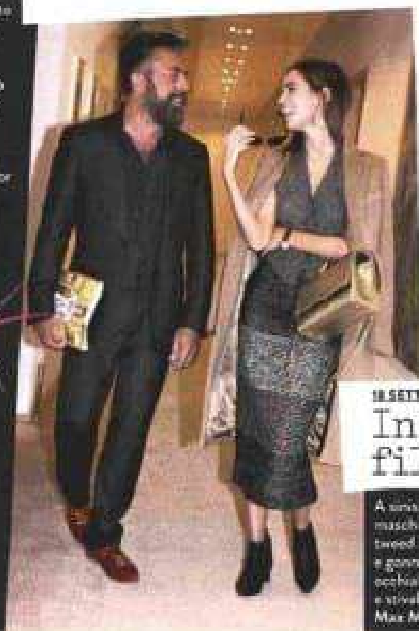
18 SETTEMBRE ORE 21.0