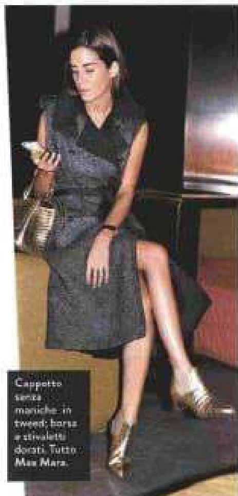
Cappotto senza maniche in tweed; borsa e stivalotti dorati. Tutto Max Mara.

«Adesso sono a Parigi, ma quando finirà, andrò per dieci giorni in India o in Thailandia. L'anno scorso ero lì in vacanza e una tempesta ha messo fuori uso Internet. Ero disperata, perché senza il web e il contatto con i follower mi sento persa. Ma questo blackout ha avuto un effetto disintossicante: mi sono riposata come non succedeva da anni». E chissà se anche i suoi follower saranno d'accordo. ■